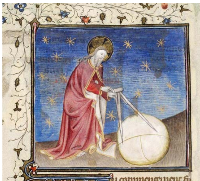
'Dieu écrit droit et nous lisons de travers'

J'ai un voisin qui tient à travailler le samedi. L'Exode, chapitre 35, verset 2, dit clairement qu'il doit être condamné à mort. Je suis obligé de le tuer moi-même ? Pourriez-vous me soulager de cette question gênante d'une quelconque manière ?